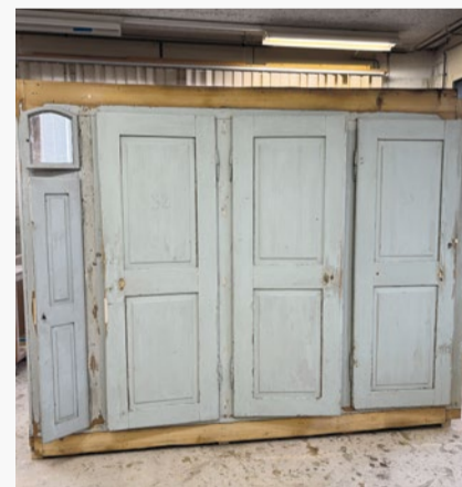
Antiker Schrank wird aufgefrischt, in unserer Werkstatt.

Oft reicht schon eine kleine Reparatur, damit Ihnen ein Objekt noch viele Jahre Freude bereitet. Ob Instandsetzen oder neu anfertigen – wir finden in jedem Fall die passende Lösung für Sie. Sie entscheiden, ob etwas erhalten oder ersetzt werden soll. Auch kleine Aufträge liegen uns am Herzen: Wir richten Küchentürli, entklemmen Schubladen, reparieren Stuhlbeine. Und nach einem Glasbruch sorgen wir schnell und unkompliziert für Ersatz.