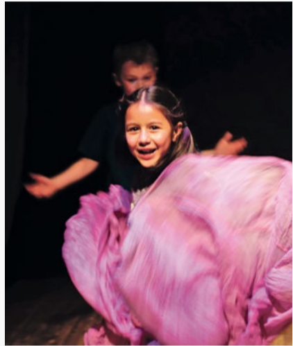
Kursphoto La Scaletta 2025

Auch dieses Jahr widmet sich das Kinder und -Jugendtheater «La Scaletta – die junge Bühne im ATM» einem Klassiker der Weltliteratur. Hans Christian Andersens Märchen «Die Schneekönigin» wurde in mehr als 125 Sprachen übersetzt und gehört zu den weltweit bekanntesten literarischen Werken.