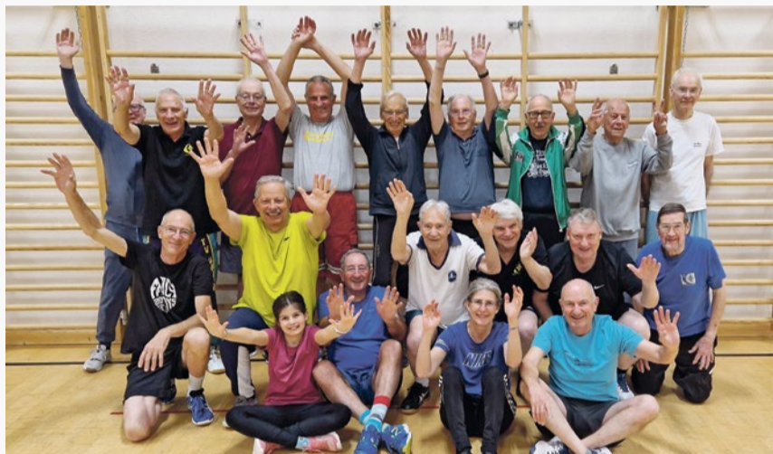
Gelegentlich haben wir sogar Besuch von angehörigen Damen!

Gelenkig, geschickt und kräftig in jedem Alter! Neu: mit assoziierte Ballsportgruppe, eine Generation jünger. Liebende Herrlibergerin, motivier' deinen Mann, da mitzumachen. Es kommt euch beiden zugute!