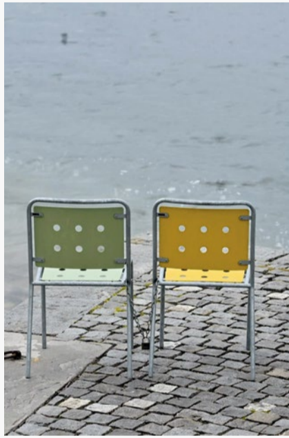
Er ist weg!

Gemeinsam feiern die reformierten Kirchgemeinden Erlenbach und Herrliberg den Gottesdienst zu Auffahrt. Dass Gott sich mit der Auffahrt Christi aus der Welt verabschiedet hat, ist der erste Eindruck nach der Lektüre der klassischen Texte aus dem Neuen Testament dazu.