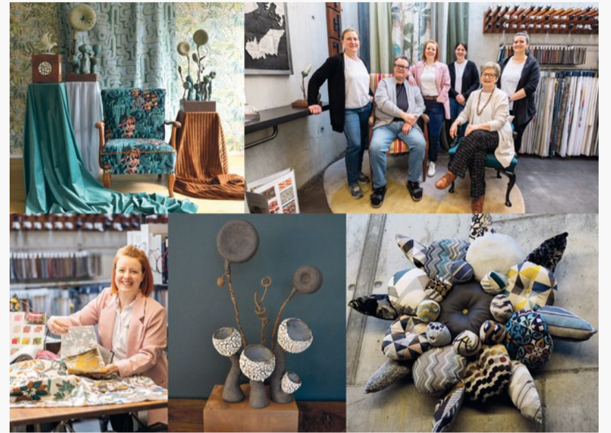
Jubiläumsausstellung Polsterhüsli_Kunstatelier coat Uetikon

wohnen und Natur vereint werden können. zVg