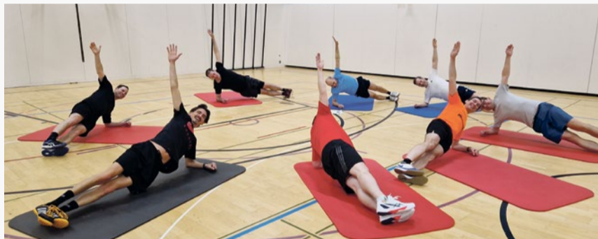
Intensives Aufwärmen vor dem Ballspiel.