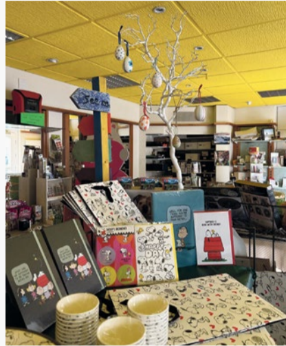
Frühlingsgrüsse mit Snoopy

Natürlich finden Sie bei uns auch allerlei Nützliches für die Ostertage, wie Servietten, Osterkarten, Bündeli, Osterkörbli und Ostergras. Zudem halten wir viele Geschenkideen von Lego und Legami, Spiele sowie kreative Bastelideen für Sie bereit. Wir von der Papeterie im Dorf freuen uns schon heute darauf, Sie in unserem Laden und am Frühlingmarkt am 9. Mai begrüssen zu dürfen. zVg