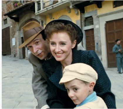
La vita è bella

Die evangelischen Motive des Leids, der Aufopferung und der Kraft der Hoffnung werden uns im Gottesdienst zu Karfreitag beschäftigen. All das spielt auch im Film «La vita è bella» von Roberto Benigni, den wir am Mittwoch der Karwoche gezeigt haben, eine Rolle. Sie sind herzlich willkommen, diesen Weg der Besinnung mit uns zu gehen.