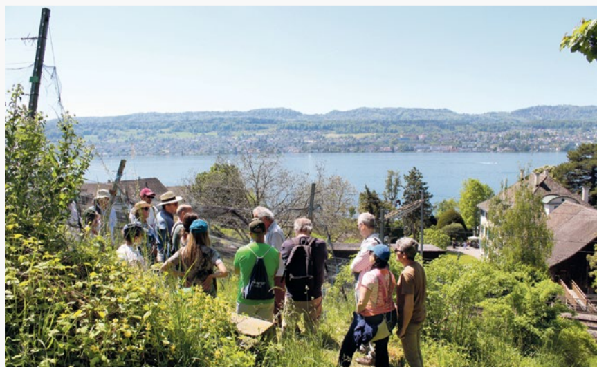
Die Rebber-Führung findet dieses Jahr um 14 Uhr statt.

Seit über 20 Jahren setzt die Martin Stiftung auf pilzwiderstandsfähige