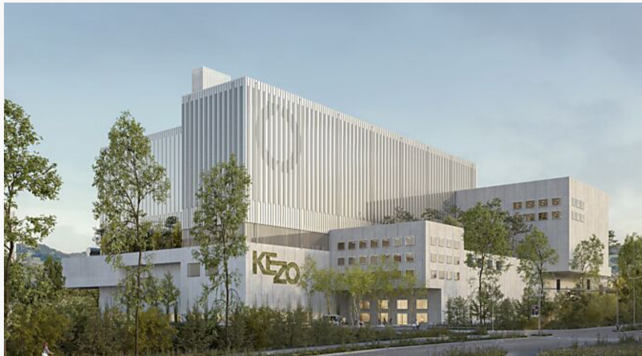
So soll die neue KEZO aussehen.

Die KEZO plant in Hinwil einen Ersatzneubau ihrer Kehrrechtverwertungsanlage. In den letzten Monaten wurde dazu ein Masterplan erarbeitet. Diesen stellt die KEZO nun an einer öffentlichen Informationsveranstaltung am 7. Mai 2026 in Hinwil vor.